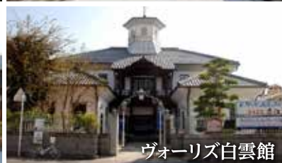
ヴォーリス白雲館

観光スポットは、「八幡堀」・「安土城跡」・「町並み」・「日牟禮八幡宮」・「八幡山城跡」・「森五郎兵衛邸」・「長光寺」など盛り沢山です。事前の見学コースチェックをしましょう(^ ^)。