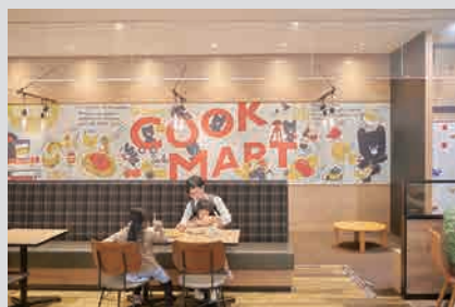
クックマート PLANNING / VI / CI / COPYWRITING / GRAPHIC DESIGN / WEB DESIGN