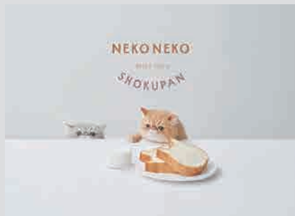
ねこねこ食パン PLANNING / VI / CI / LOGO DESIGN / COPYWRITING / PHOTOGRAPH / STYLING / GRAPHIC DESIGN / WEB DESIGN / PACKAGE DESIGN