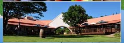
▲昼食はサンクゼール・ワイナリー長野で(△o△)。