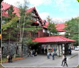
▲上高地・帝国ホテル(昼食処・自由)