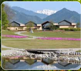
▲ちひろ美術館(安曇野)