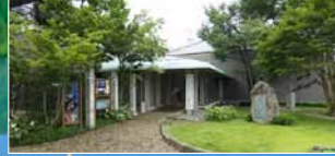
▲画狂老人・葛飾北斎筆画の世界「北斎館」

室町初期1408年建立、今では貴重な茅葺屋根も2007年に置き替え工事を行い綺麗になりました。また縁結びのお薬師さんとしても親しまれ若い男女も多く訪れています。