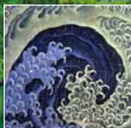
▲画狂老人・葛飾北斎筆画の世界「北斎館」