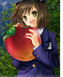
▲上高地線イメージキャラクター