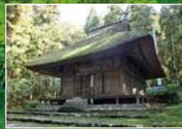
▲国重要文化財・浄光寺薬師堂