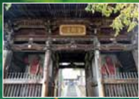
▲国宝・岩松院仁王門